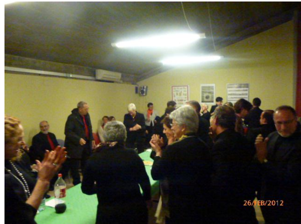
Trobada de Corals.

El Local social de Montilivi es va inaugurar el mes de juny de 2005. Des de llavors ha anat acollint tot tipus de reunions, assemblees, celebracions i activitats.