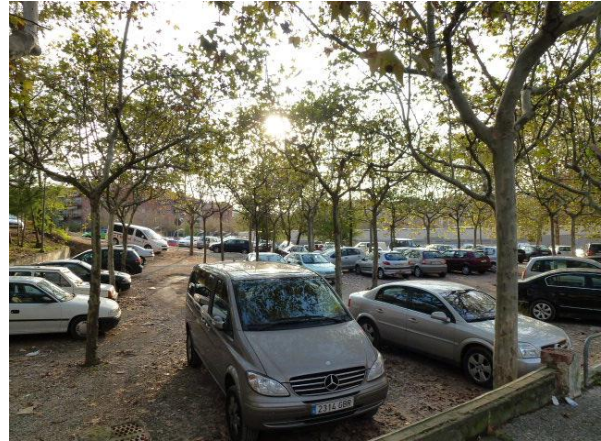
Solar antiga Petanca

El nucli de Montilivi fa temps que pateix de forma crònica problemes d'aparcament en superfície. Problema que s'ha vist agreujat a partir de 2003 – 2004 amb la posada en funcionament d'un equipament de ciutat tant important com és el CAP Montilivi. Aquesta situació es preveu que s'agreujarà amb la posada en funcionament el curs vinent de la nova escola Pericot.