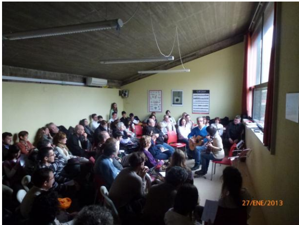
Audició, per torns, dels alumnes de guitarra.