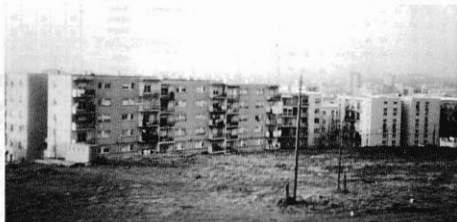
Tots esperem que un dia aquesta foto sigui de color.

Com recordeu, a la darrera reunió amb els Presidents d'escalas, van quedar en que us informaria sobre el que s'hagi parlat amb l'Ajuntament.