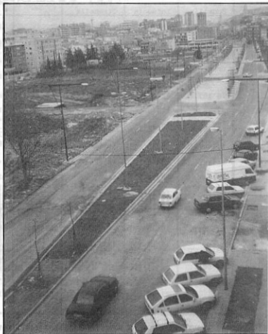
Perspectiva Pla de Girona

L'edifici de l'actual col·legi Públic Professor Pericot podria convertir-se en un Centre de Secundària.