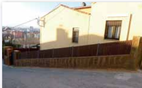
Necessitem una barana per als vianants del c. Ullastret

L'activitat del CAP i la manca d'aparcaments a la zona reclamen una actuació que passaria per anivellar i asfaltar la parcel·la que actualment s'utilitza d'aparcament.