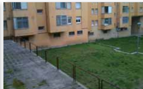
Col·laborar en la solució del pati interior de Catell Soterra, Tuyet i Santamaria i Dr. Bolós.