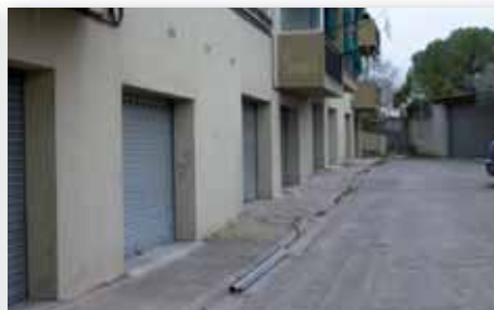
Pavimentar la vorera del perímetre de Punta del Pi