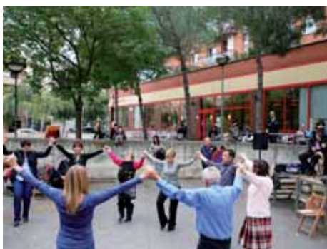
3/11/2012: XVII Trobada de Sardanes i Castanyada de Fires de Girona. La primera trobada de Sardanes va tenir lloc el mes de setembre de 1996.