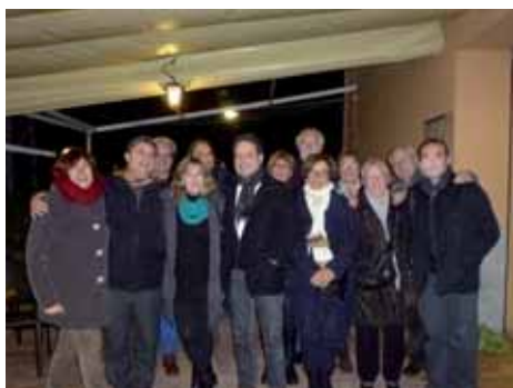
Sopar del Grup de Teatre Montilivi per celebrar les interpretacions de les "Dones Sàvies" de Molière.