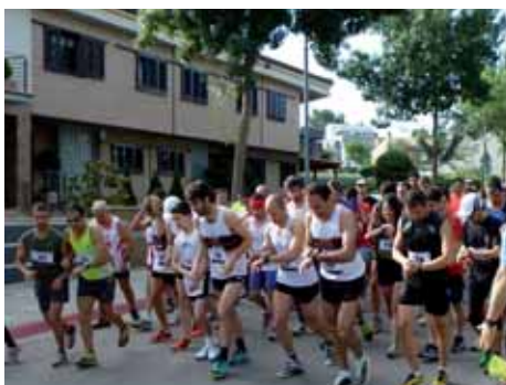
Tret de sortida de la XXIX Marxa Popular de Montilivi amb més de cent corredors.