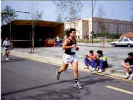
1992: Arribada d'un corredor a l'Avinguda Pericot. Al fons l'edifici Cent Llars. Pericot sense edificis.

La Marxa Popular de Montilivi, amb la Festa Major, és l'activitat més antiga de l'Associació de Veïns. Aquest any celebrarem la seva trentena edició. Aquí teniu algunes fotos que són història.