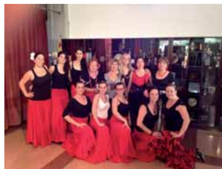
Sevillanes després de la seva actuació a la Festa de fi de curs de les activitats de l'AV. al Casal Cívic Montilivi. 14/06/2012