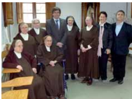
Visita a les germanes Carmelites Descalces de Montilivi.