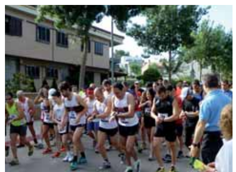
2012: Sortida de la Marxa des de la Plaça Ciutat de Figueres.