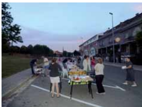
Tradicional sopar al carrer per la revetlla de Sant Joan dels veïns de la Font de l'Abella.