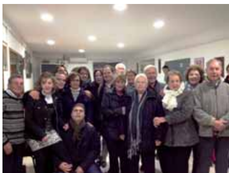
Interpretació de les "Dones Sàvies" de Molière, a la Mostra de Teatre de Sarrià de Dalt, 02/12/2012.