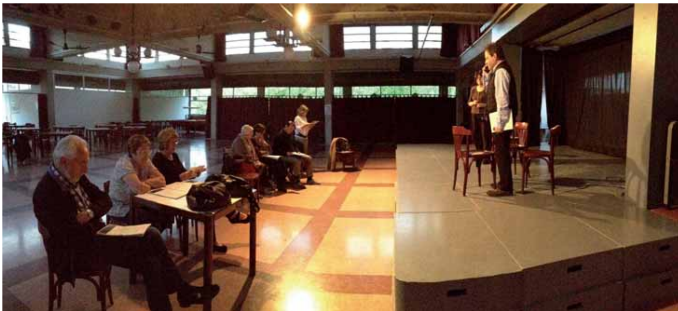
Assaig de teatre al Casal Montilivi

de les escoles de l'entorn, als adults del barri a la gent gran de tota la comarca de Girona. Ara s'ha perdut però l'experiència va ser molt bona.