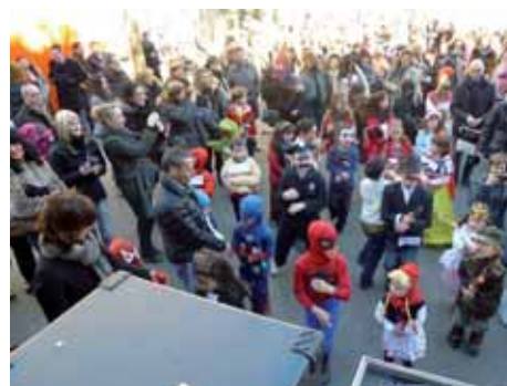
Èxit rotund de la Festa de Carnestoltes d'aquest any amb el ritme de "Gangnam Style".