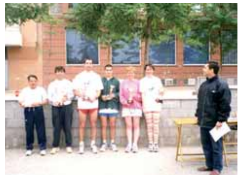
1999: Lliurament de trofeus. Absolut masculí, Absolut femení, Revelació, Veterà, Primer i Primera del Barri.