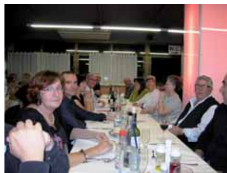
10/11/2012: Sopar de la Junta i els col·laboradors. Un detall per agrair la seva dedicació desinteressada a l'Associació de Veïns.