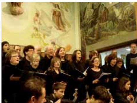
Nadales de la Coral i Acords Joves a les Carmelites Descalces de Montilivi.