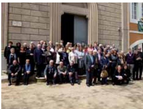
Actuació de la Coral Montilivi a la Festa de la Unió dels antics alumnes salesians de Girona.