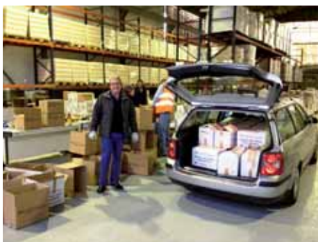
Magatzem del Banc dels Aliments a Girona. Operació de descàrrega del cotxe de l'AV. Gran Recapte a Montilivi. 30/11 i 01/12 de 2012.