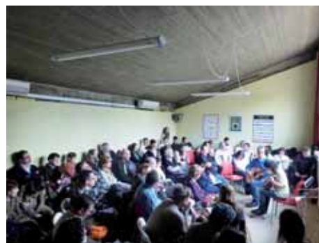
Audició que ofereixen els alumnes de guitarra als seus pares i amics al Local Social de Montilivi. 27/01/2013