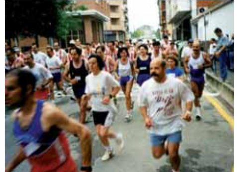
1998: Sortida de la Marxa des del c/ Joaquim Ruyra, al costat de l'antic forn Bellsolà.