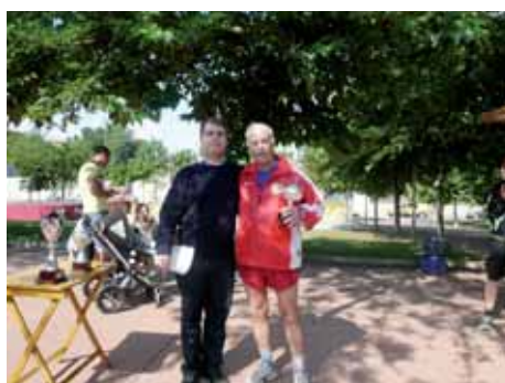
2011: Trofeu al més veterà.