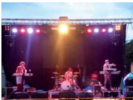
Preparatius de l'orquestra a la Festa del Barri.