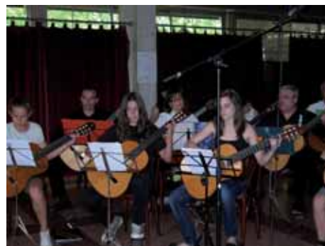
Recital de guitarra a càrrec dels alumnes de l'Euken a la Mostra artística al Casal. 10/06/2012.