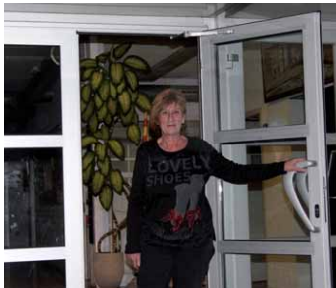
Estic a la vostra disposició

Sí, i et puc posar un exemple. Des de fa sis anys, l'Ajuntament de Girona utilitza aquest espai pel Centre Obert, un servei social específic coordinat per l'educador