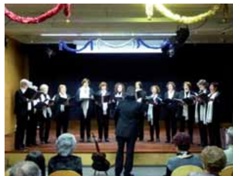
Concert de Nadales de les Veus Blanques, organitzada per l'AV. del Pont al Centre Cívic de Pont Major.