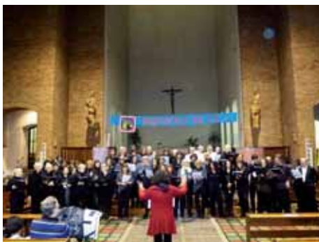
Trobada de Corals a Sant Josep.