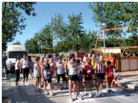
2006: Sortida de la Marxa des de la Plaça Ciutat de Figueres.