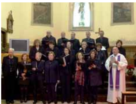
Coral Montilivi a Siurana d'Empordà.