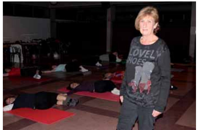
L'activitat dona sentit al Casal

de l'Associació de la Gent Gran va veure amb bons ulls que l'equipament s'obris el màxim possible al barri i es compartissin les instal·lacions. L'any 1994 vam iniciar aquesta relació amb una festa important: una trobada de sardanes on també van actuar els Marrecs de Salt. Era una activitat no només per a gent gran sinó oberta a tot el barri i es va organitzar conjuntament amb l'Associació de Veïns de Montilivi. El 3 de novembre de l'any passat vam celebrar la dissetena edició d'aquesta trobada.