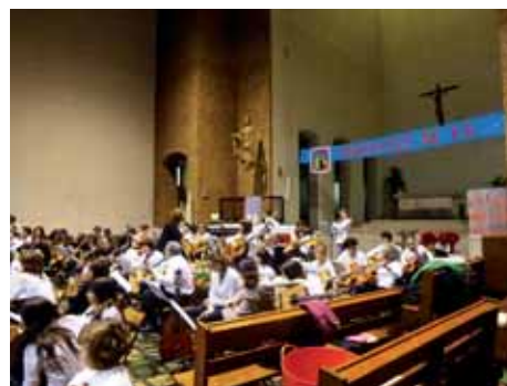
Nadales dels alumnes de guitarra de l'Associació.