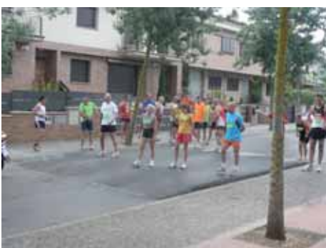
2010: Sortida de la Marxa des de la Plaça Ciutat de Figueres.