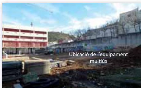
Ubicació de l'equipament multiús

Seria un lamentable fracàs que no es construís l'equipament multiús projectat per a l'escola Pericot. Malgrat les dificultats, no trobarem millor moment que l'actual per a no quedar-nos curts i completar aquesta obra.