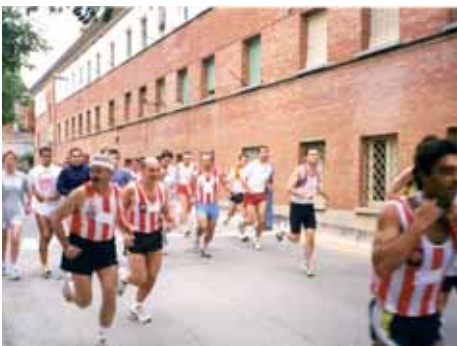
1999: La Marxa anava a buscar el camí vell del carrilet de Sant Feliu.