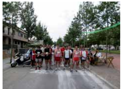
2007: Sortida de la Marxa des de la Plaça Ciutat de Figueres.