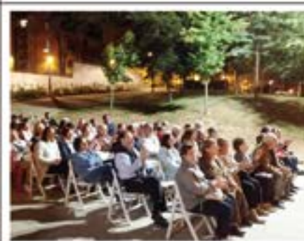
XXIII Havaneres de Montlivi.