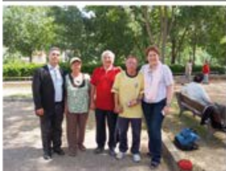
2014_06_08 Concurs de petanca Montlivi.