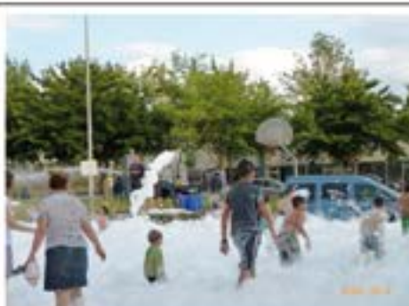
2014_07_98 Festa de l'escuma.