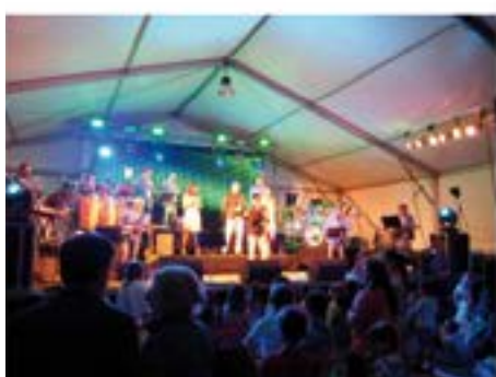
2014_06_08 Actuació de la Metropol.