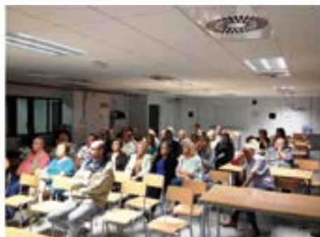
22/10/14. El regidor d'urbanisme i tècnics presenten un esboç de projecte d'urbanització de Punta del Pi.