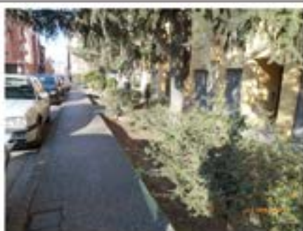
Protegir amb una barana el desnivell amb els jardins del c. Tuyet i Santamaria.