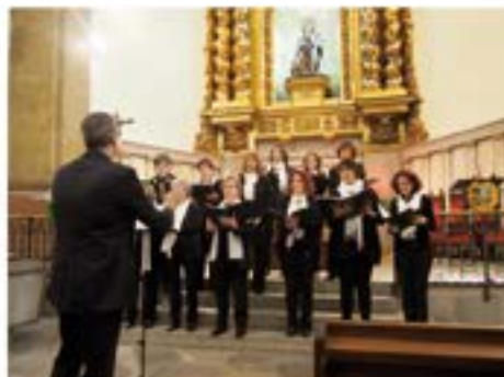
2014_05_18 Missa i recital de les Veus Blanques a la parròquia del Carme.