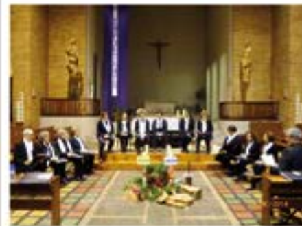
14/12/2014. Trobada de Corals a l'església de Sant Josep.