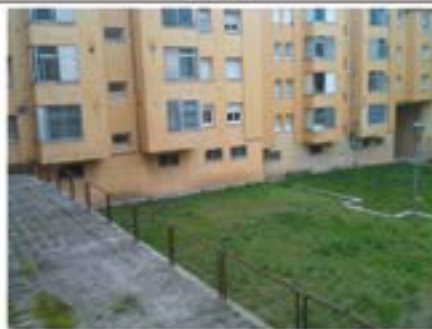
Acordar la cessió a l'Ajuntament de la plaça interior i els jardins perifèrics de l'illa de pisos dels carrers, Tuyet Santamaria, Dr. Bolós, Emili Grahit i Castell Solterra.