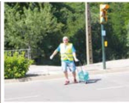
2014_06_05 Preparatius de la XXXI Cursa de Montlivi