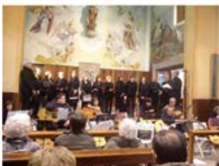
13/12/2014. Concert de Nadales al convent de les Carmelites Descalces de Montlivi.