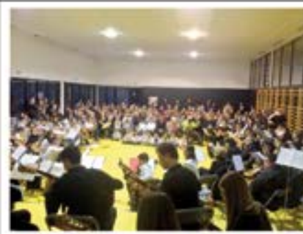
13/12/2014. Audició que els alumnes de guitarra van oferir al nou gimnàs de l'escola Pericot.