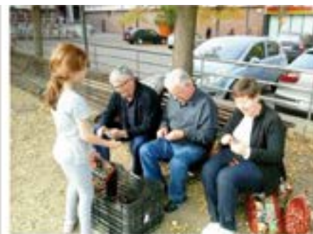
22/11/2014. Sardanes i Castanyada de Montlivi amb la Cobla Ciutat de Girona.