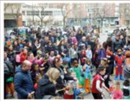
14/02/2015. Gran Festa de Carnestoltes a Montlivi. Èxit de participació de disfresses infantils i comparses.