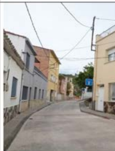
LABORAR i APROVAR UN PLA INTEGRAL PER AL SECTOR DE LA MUNTANYA INCLOENT LES ACCIONS SEGÜENTS: Construcció de voreres. Posar una barana al c. Turó Rodó. Treure les comeses aèries. Pavimentar amb porland tots els carrers del sector muntanya.