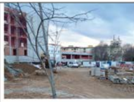
Construir un aparcament dissuasiu a l'entrada de Girona pel c. Emili Grahit.