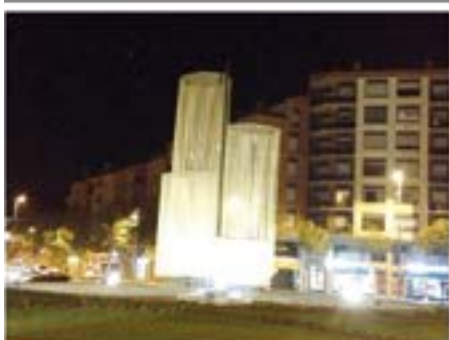
28/11/2015. Primer any de guarniment de Nadal a Montlivi. Finalment es va haver de retirar per seguretat.