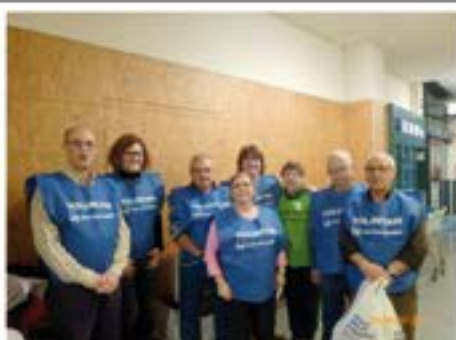
29/11/2014. Montlivi col·labora en el Gran Recapte del Banc dels Aliments a Bonpreu i Condís.