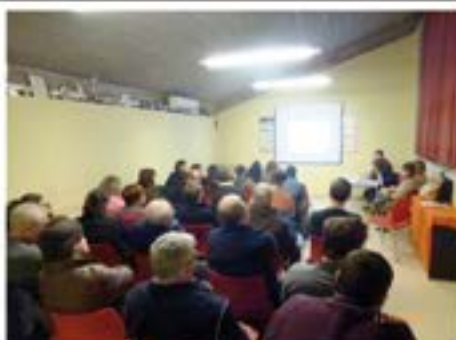
12/02/2015. Assemblea de Barri del Pressupost Participat.