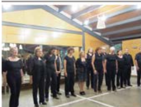
Trobada de coral a Pedret.