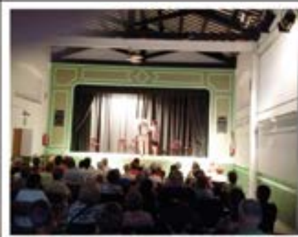
Teatre a Flaçà.