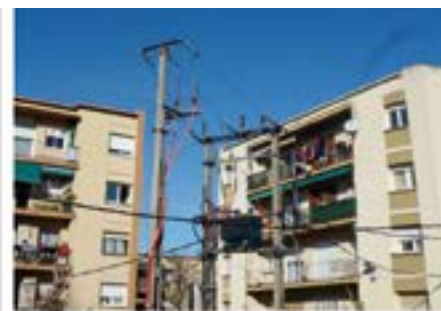
Soterrar o eliminar el transformador aeri.