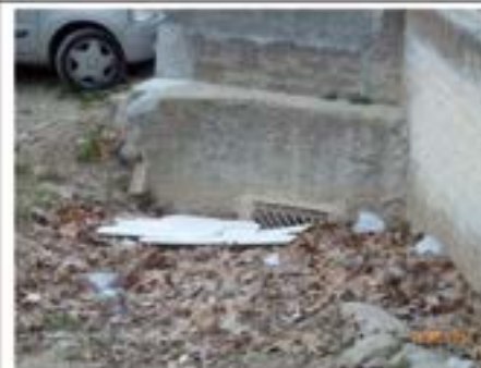
Executar el Pla General que preveu connectar el c. Castell Solterra amb el c. Josep Clarà, habilitar el solar de l'antiga Petanca com a aparcaments i canalitzar el desguàs de les aigües pluvials fins al registre construït, si escau, un tanc de tempesta per a prevenir inundacions al c. Tuyet Santamaria i al CAP.