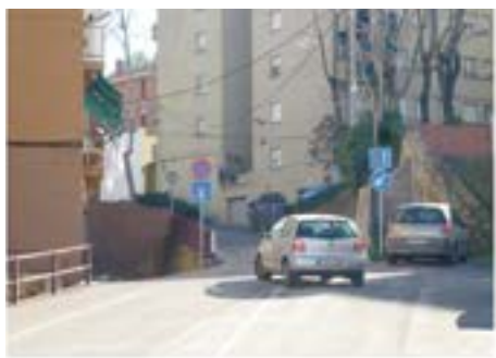
APROVAR i EXECUTAR el projecte d'urbanització dels accessos a la Punta del Pi i el sector de la Muntanya presentat, recentment, als veïns de Montilivi.