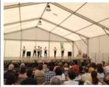
2014_06_08 Con Class.