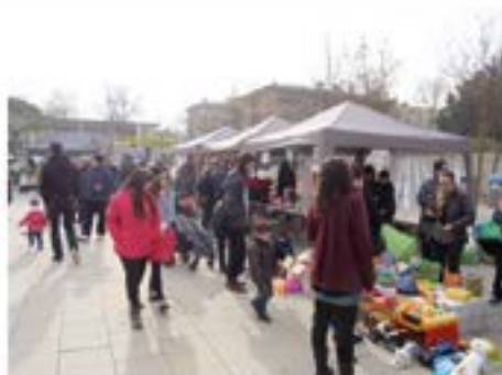
14/12/2014. I Fira de la joguina que organitzen per Nadal, les AMPEs i l'Associació de Veïns.