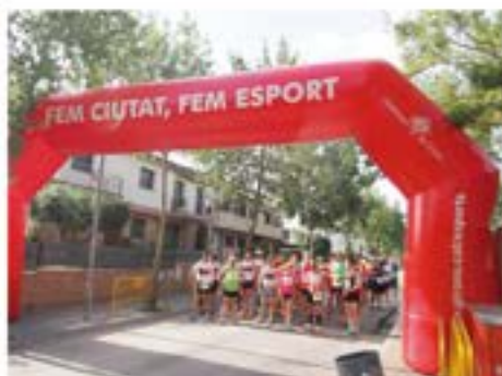
2014_06_08 XXXI Marxa Popular de Montlivi.