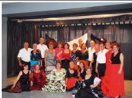
2014_06_ Comiat de les activitats: Sevillanes.