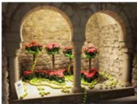
2014_05_09 Decoració als Barys Àrabs per Temps de Flors.