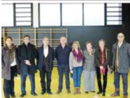
29/01/2015. Signatura del conveni de cessió d'ús del gimnàs de l'escola Pericot en horari no lectiu a l'AV. Montlivi.