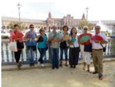
4/10/2014. El cor Veus Blanques de Montlivi va oferir dos concerts a Sevilla.