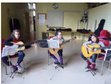
5 març - Junta directiva de l'Associació