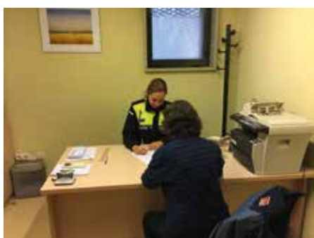
30 gener - Presentació guàrdia de barri