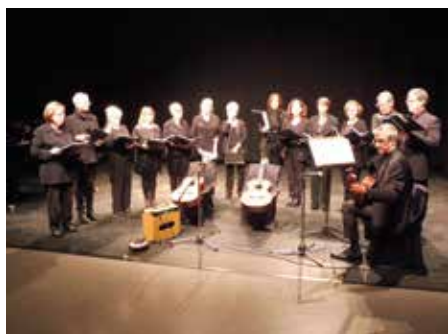
7 maig - Coral a Massanet de la Selva