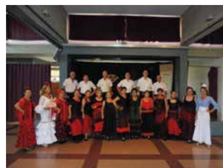
15 juny - Mostra Artística al Casal