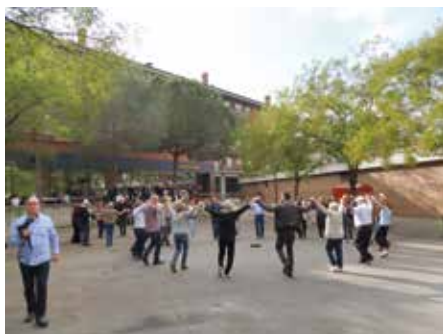
4 setembre - Sardanes i Castanyada de Fires