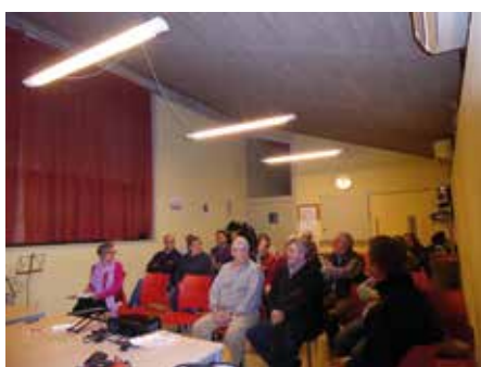
26 febrer - Assemblea General del Barri