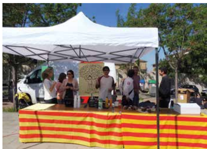
Festa de Sant Jordi 24 d'abril de 2017