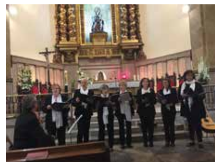
13 maig - Veus Blanques a la parròquia del Carme