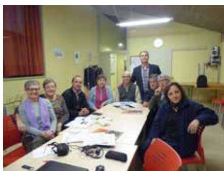
6 març - Temps de Flors. Claustre Museu d'Història