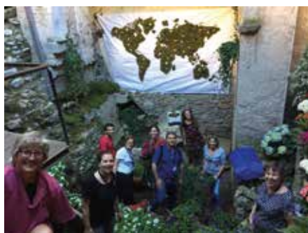
12 maig - Temps de Flors. Banys Àrabs