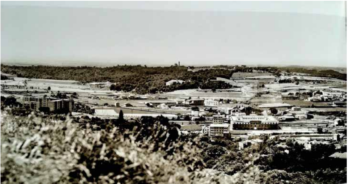
CRDI-Foto de 1963, atribuïda a en Narcís Sans.

les persones que venien a buscar aigua en relació a les seves excel·lents qualitats per a coure llegums secs. Ens costava de creure-ho, però si ho va constatar una anàlisi, segurament que algun tipus de contaminació hi devia haver. Per això, el 1975, l'Ajuntament la va fer tapiar.