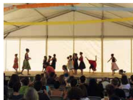
11 juny - Alumnes de Conc-Class