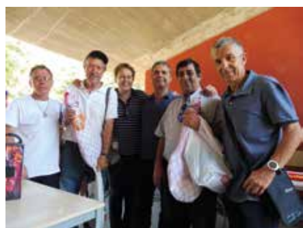
11 juny - Campionat de Petanca