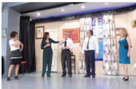
17 juny - "Políticament incorrecte" Teatre al Casal