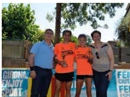
11 juny - Trofeus XXXIV Marxa Popular Montilivi