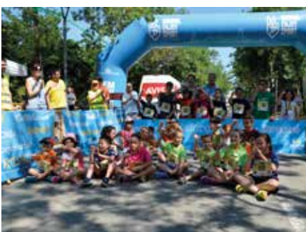
11 juny - Correbarris Infantil