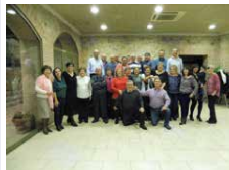
11 setembre - Trobada festiva dels voluntaris de l'Associació