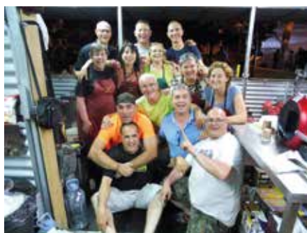
10 juny - Voluntaris a la barraca de Montilivi