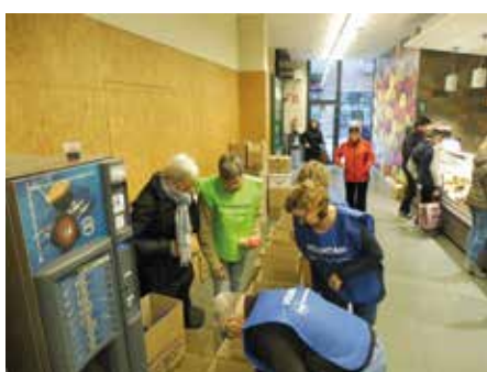
17 desembre - Fira de la joguina