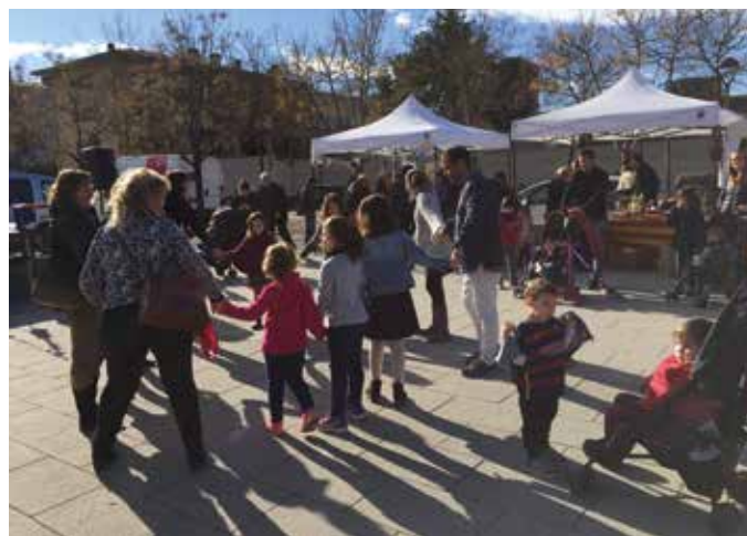
Fira de la Joguina desembre 2017

A més, la nostra AMPA forma part, conjuntament amb altres AMPA i entitats del Barri i l'Associació de Veïns de Montilivi, del Consell d'Entitats del barri de Montilivi. Aquesta iniciativa ens ha permès sumar esforços en la realització d'activitats conjuntes com la Fira de Nadal i de la Joguina en bon estat, el Carnestoltes del Barri i la Festa de Sant Jordi.