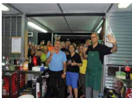
11 juny - Salutació pel fi de Festa Major