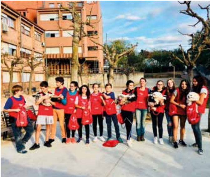
Imatge d'una de les activitats extraescolars

Quan els nostres fills i filles arriben a l'etapa de secundària per continuar els seus estudis, a la majoria de pares i mares ens preocupa si seran capaços de fer aquest camí de forma òptima pels seus interessos amb tot el que això comporta. Faran noves amistats, hauran de ser responsables amb els deures i també hauran de ser capaços d'administrar el seu temps per tal d'assumir totes les seves obligacions com a estudiants i també com a companys i persones. Aquesta etapa de descobriment, per ells, segur que serà un temps on hauran de fer front a nous reptes, el seu cos també canviarà i segurament alguns tindran la possibilitat de conèixer a companys i companyes que els acompanyaran durant la resta de la seva vida. La major part de la tasca educativa que faran els nostres nois i noies a l'Institut la conduirà el personal docent però els pares des de l'AMPA també hi volen tenir un petit paper, i així crear un lligam entre el centre docent i les famílies. És una tasca difícil, però els membres de la junta la fem amb moltes ganes i també molt convençuts que servirà per millorar un xic la vida acadèmica dels nostres nois i noies. Acompanyar-los en el camí que fan per convertir-se en persones adultes, organitzant diferents tasques tant en el mateix institut com en el barri de Montilivi, on els estudiants tinguin l'opció de participar-hi, és un repte.