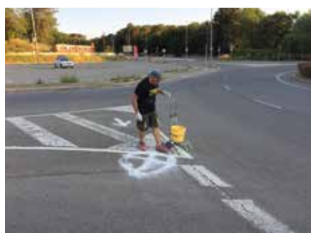
10 juny - Quique Funes marcant el circuit