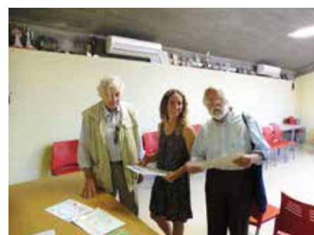
11 juny - Jurat del Concurs de Dibuix