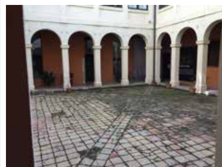
11 abril - Assaig de Guitarres