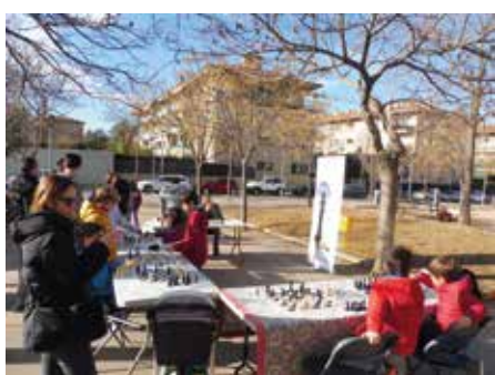
2 desembre - Gran Recapte