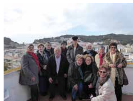
4 març - Excursió a Tossa de Mar