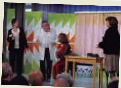
2019_04_13 Estrena de l'obra "Bojos del Bisturí" a Casal Cívic Montilivi.