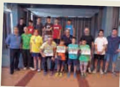
2019_06_07 Torneig de Tennis-Taula.