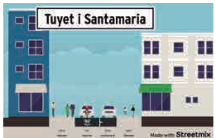
Una de les possibles alternatives per a la reforma.

Plantejar aquesta proposta als veïns i reclamar a l'Ajuntament la reforma del carrer amb la força de l'AV Montilivi podria servir perquè des del consistori es posés fil a l'agulla.