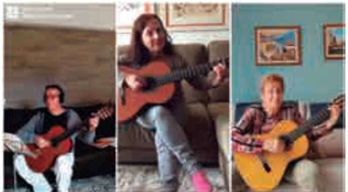
Assajos durant el confinament, abril 2020.

El mateix hem fet els integrants de la Coral Montilivi i del Grup d'Havaneres Montilivi. Ens hem quedat sense assajos, ens hem quedat sense concerts... però no sense il·lusió, ni sense ganes de treballar.