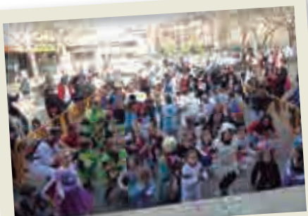
2020_02_29 Festa de Carnestoltes de Montilivi.