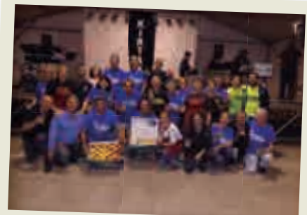
2019_06_09 Voluntaris que fan possible la Festa Major de Montilivi.