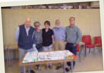
2019_06_08 Jurat del concurs de dibuix.