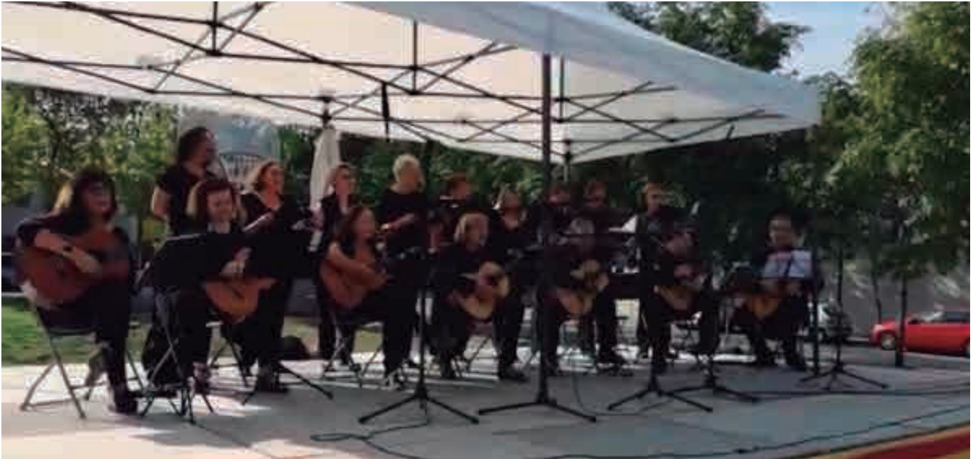
Coral i guitarres de Montilivi a la Festa de la Federació d'Associacions de Veïns de Girona, 5 d'octubre 2019

El confinament ens ha canviat la vida a tots. Moltíssim, força, una mica... I no sabem quant durarà, ni si podrem tornar a la nostra rutina d'abans. Per això, qui més qui menys s'ha hagut de reinventar.