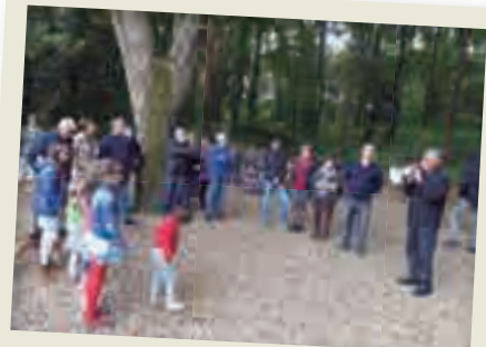
2019_05_03 Inauguració Font de l'Abella.