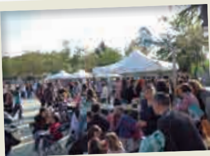
2019_04_23 Sant Jordi.