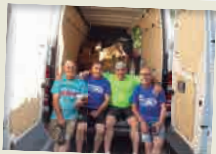
2019_06_08 Voluntaris "incombustibles" marcant el circuit de la XXXVI Marxa Popular de Montilivi.