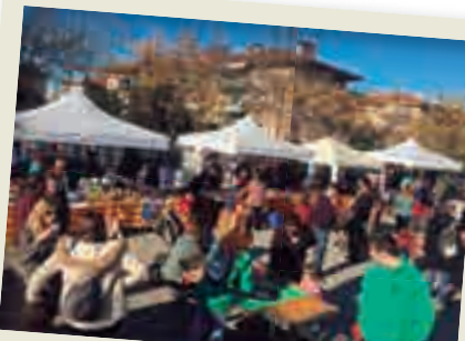
2019_12_15 Fira de la Joguina de segona mà en bon estat.