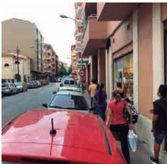
Carrer Tuyet actualment, a l'alçada de la carnisseria.

No cal sortir del barri de Montilivi per trobar-ne exemples, el més clar dels quals és, segurament, el del carrer d'Andreu Tuyet i Santamaria. El carrer Tuyet, com n'hi diem els veïns del barri, i l'avinguda Pericot, és l'únic eix comercial, a més de ser una via d'accés al CAP o a l'escola Pericot.