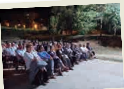
2019_09_06 XXVII Cantada d'Havaneres de Montilivi.