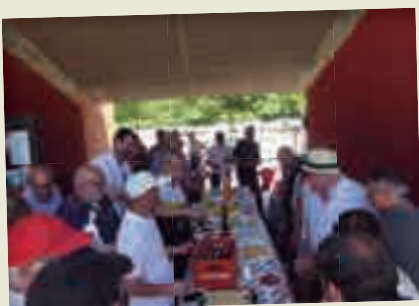
2019_06_09 Torneig de Petanca "Festes de Montilivi".