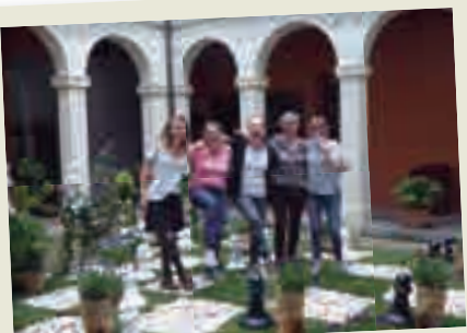
2019_05_12 Temps de Flors.